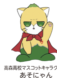
高森高校マスコットキャラクター あそちゃん

草原の魅力や、地元の小中学生を対象に開催した草原の草花を使ったしおり作り体験などについて発表がありました。